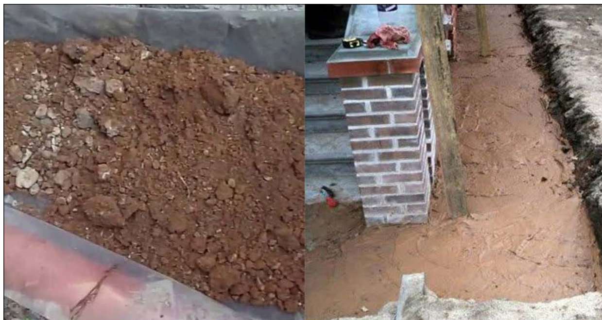
Рис. 2. Устройство глиняного замка с применением бентонитовых глин

3. Инъекционная бентонитовая гидроизоляция представляет собой инъекционные смеси на основе гранулированной смеси натриевого бентонита (монтморрилонит не менее 90 %) и полимерных доба-