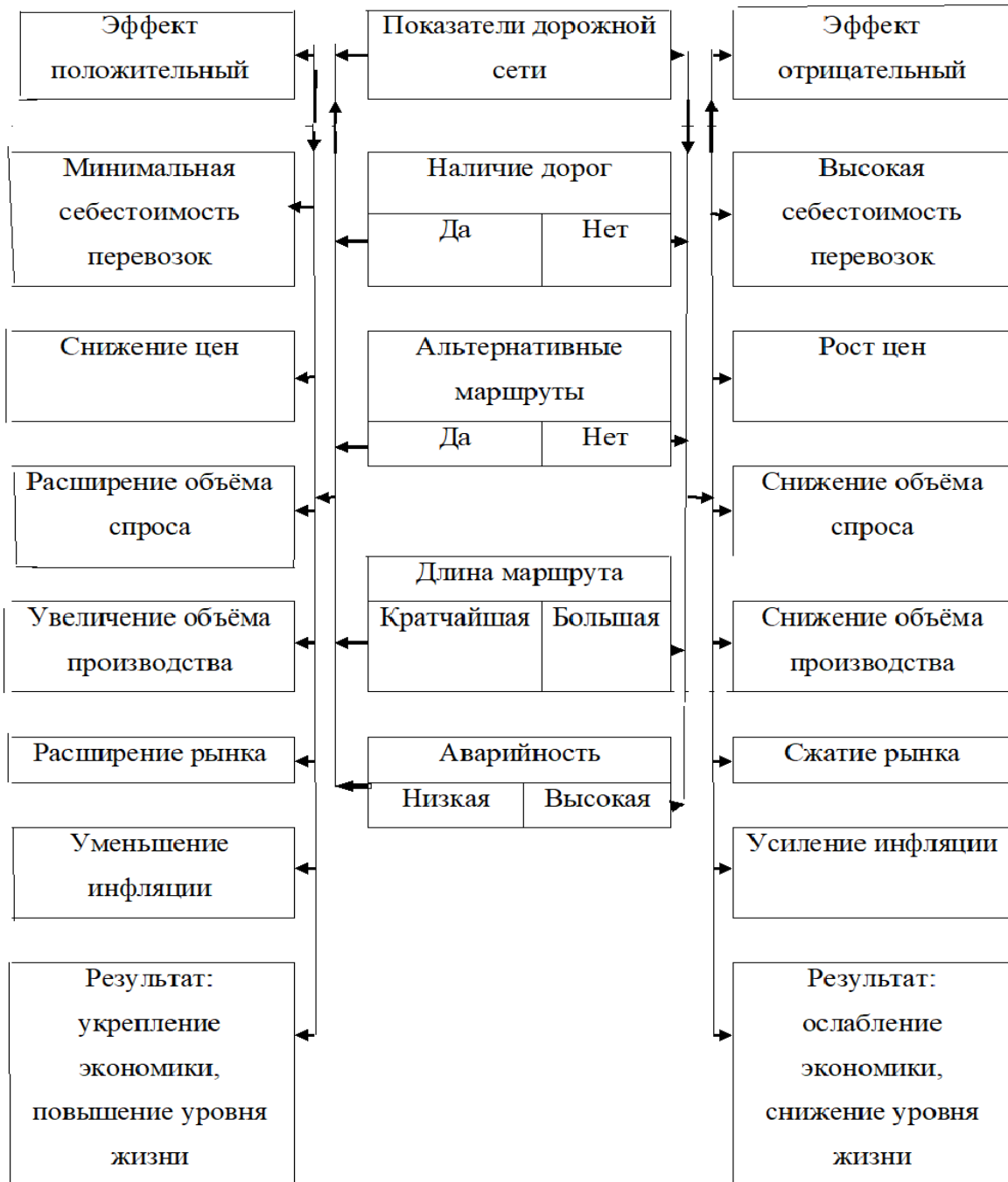
Рис. 1. Влияние на экономические процессы в обществе и государстве

Одним из важных показателей положительного эффекта от строительства разветвленной сети автомобильных дорог является наличие дублирующих маршрутов, соответствующих потребительским и транспортно-эксплуатационным качествам: протяжению (прямолинейности), скорости движения, затраченному времени в пути, безопасности дорожного движения и т. п. (рис. 1–3).