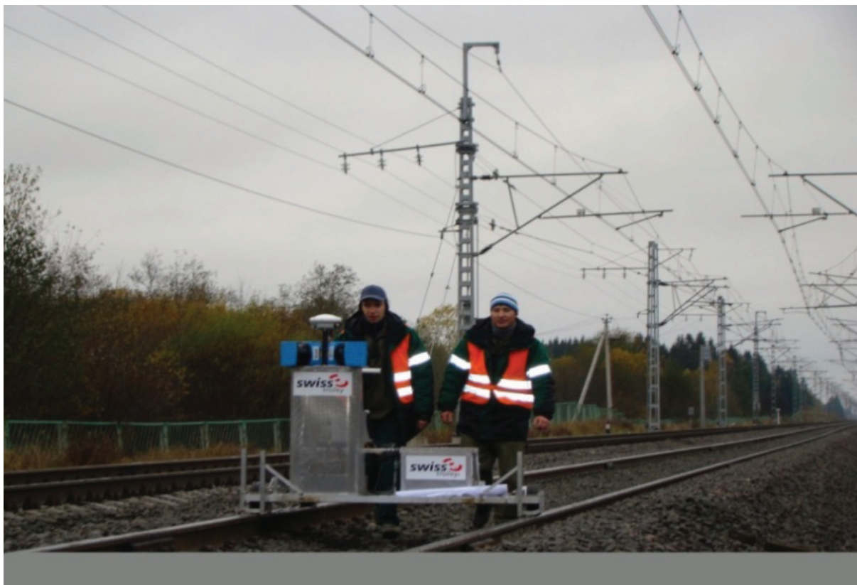
Рис. 2. Внешний вид путеизмерительного комплекса Swiss Trolley

в зависимости от поставленной задачи. Кроме измерения положения железнодорожного пути в плане и по высоте, оборудование всех АПК позволяет измерять ширину колеи, возвышение наружного рельса, стрелы изгиба и перекосы [4, 6].