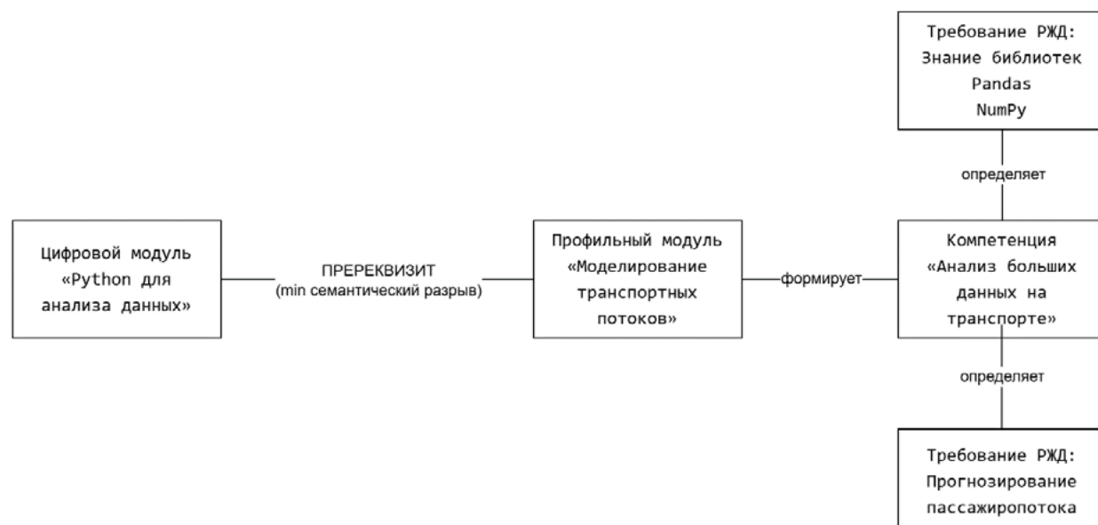
Рис. 3. Логика интеграции цифрового модуля в граф пререквизитов