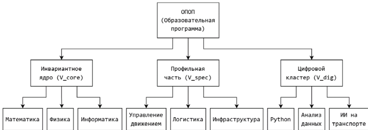
Рис. 1. Иерархическая структура ОПОП

V_{\text{spec}}(T) — вариативная профессиональная часть , мощность и состав которой являются функциями от времени T . Именно этот компонент подлежит оптимизации для удовлетворения требований отраслевого заказчика;