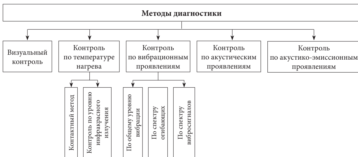
Рис. 1. Методы диагностики

обмоток, вибрацию корпуса двигателя, что позволяет выявлять аномалии работы установки на ранней стадии.